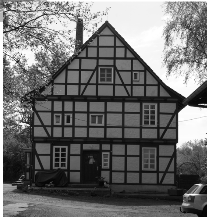
Im Wohngebäude sollen Gruppen- und Seminarräume entstehen.

Die große Scheune wird derzeit als Lagerfläche für die Forstwissenschaften genutzt, die Pläne des Gebäudemanagements sehen für dieses Gebäude u.a. einen Hörsaal mit ca. 170 Plätzen und große Seminarräume vor. Zumindest für diesen Hörsaal wäre die neue Lage sicherlich auch von Vorteil, da dieser vor allem für die Forstwissenschaften benötigt wird, deren größter Hörsaal derzeit nur 100 Plätze hat. Das große Fachwerkhaus ist derzeit als Wohngebäude vermietet. Dieses Gebäude wäre vor allem für die kleineren Seminar- und die Gruppenarbeitsräume vorgesehen. Außerdem besteht die Idee, im Erdgeschoss eine Gastronomie einzubauen. Im Sommer könnte ein neu-