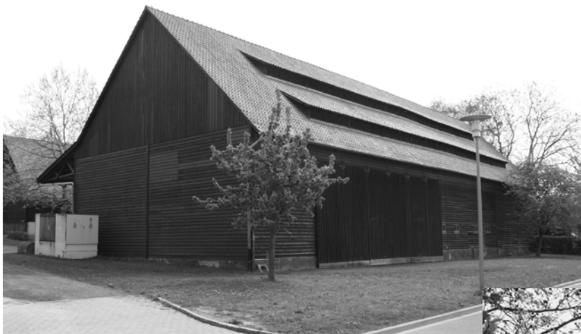
In dieser Scheune könnten demnächst Vorlesungen stattfinden.

Grundsätzlich unterstützen wir als ADF die Schaffung zusätzlicher Lern- und Seminarräume am Nordcampus, diese neueste Idee sehen wir jedoch sehr kritisch. Wir werden die kommenden Wochen